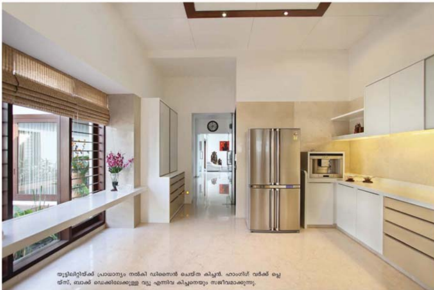
തുട്ടിലിറ്റിന്റേക്ക് പ്രാധാന്യം നൽകി ഡിസൈനർ ചെയ്ത കിച്ചൻ. ഹാംഗിംഗ് വർക്ക് ചെയ്ത്, ബാക്ക് ഡ്രെക്കിംഗിലുള്ള വ്യൂ എന്നിവ കിച്ചന്തന്നെ സജീവമാക്കുന്നു.

Address: 3, White House, 44 Vishwas Colony, Alkapuri, Vadodara- 390007. Ph: + 91 265 2311136/ 2351626 email: dipen317@gmail.com, dip_gada@rediffmail.com website: www.dipengada.com