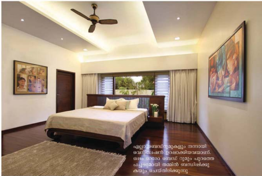
എല്ലാ ബെഡ്റൂമുകളും നന്നായി വെന്റിലേഷൻ ഉറപ്പാക്കിയവയാണ്. ഒപ്പം ഓരോ ബെഡ് റൂമും പുറത്തെ പച്ചപ്പുമായി തമ്മിൽ ബന്ധിപ്പിക്കുകയും ചെയ്തിരിക്കുന്നു.